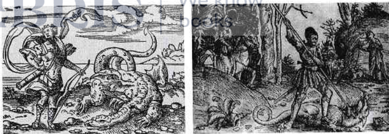
Figura 1.3. Gravură ce-l reprezintă pe Apolo, ucigându-l pe Python, de Virgil Solis pentru Metamorfozele lui Ovidiu. Cartea I (1581) (stânga), amintește de icoana pe lemn de la 1508 cu Sfântul Gheorghe omorând balaurul, de Wolf Traut (dreapta).

El și-a însușit oracolul și a construit un templu peste locul sacru din Delphi al zeiței. Apoi, preoții lui Apolo au preluat puterile profetice ale oracolului și au impus numele de Pythia, în amintirea victoriei asupra dragonului divin, Python. Alt mit spune cum Apolo i-a scos din peșteră pe cei doi paznici ai Geei, tot șerpi mitici, încolăcindu-le trupurile în jurul toiagului înaripat al lui Hermes, cunoscut sub numele de caduceu.