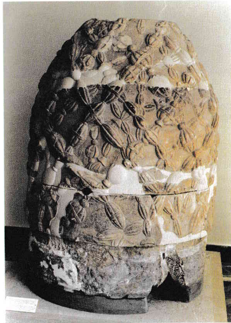
Figura 1.2. Omphalosul de la Delphi datează de la aproximativ 1400 î. Hr. Această copie romană este adăpostită de Muzeul de Arheologie din Delphi.

Potrivit mitologiei grecești, locul îi aparținuse, mai întâi, Geei. Geea era echivalentul grec al zeiței sumeriene Ninhursag, o zeităte primară, mama ancestrală a tuturor lucrurilor și prima Zeiță-Mamă a Pământului. În această calitate de zeiță htoniană, îi erau aduși ca ofrandă miei negri. Geea este adesea reprezentată ca o mamă protectoare, aplecată spre copilul pe care-l ține la piept sau înconjurată de zei micuți, văzuți ca roade ale Pământului. Peștera unde se află oracolul simbolizează pântecul Pământului, fiind păzită de șarpele gigantic și fiul Geei, Python. Apollo a uzurpat puterile htoniene ale Geei, doborându-l pe Python cu săgețile sale, așa cum o va face mai târziu Sfântul Gheorghe, ucigașul de balauri.